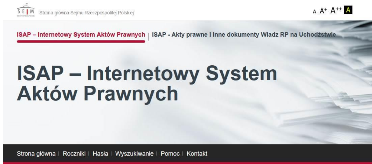
Grafika 1. ISAP - Internetowy System Aktów Prawnych.

W Dzienniku Ustaw (Dz. U.) publikowane są akty prawne, które najczęściej znajdują zastosowanie w sprawach osób potrzebujących pomocy prawnej. Natomiast ogólnodostępna baza aktów prawnych dostępna jest na stronie internetowej: www.isap.sejm.gov.pl